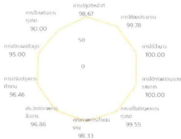
ภาพที่ ๓ ผลการประเมินรายตัวชี้วัด ประจำปีงบประมาณ พ.ศ. ๒๕๖๘

การประเมินรายตัวชี้วัดจำนวน ๑๐ ตัวชี้วัด โดยตัวชี้วัดที่ได้ค่าคะแนนสูงสุดได้แก่ตัวชี้วัดที่ ๓ การใช้อำนาจ (๑๐๐.๐๐ คะแนน) ตัวชี้วัดที่ ๔ การใช้ทรัพย์สินของราชการ (๑๐๐.๐๐ คะแนน) และตัวชี้วัดที่ ๒ การใช้งบประมาณ (๙๙.๗๘ คะแนน) ตามลำดับ สำหรับตัวชี้วัดที่ได้ค่าคะแนนต่ำสุดได้แก่ ตัวชี้วัดที่ ๑๐ การป้องกันการทุจริต (๙๐.๐๐ คะแนน)